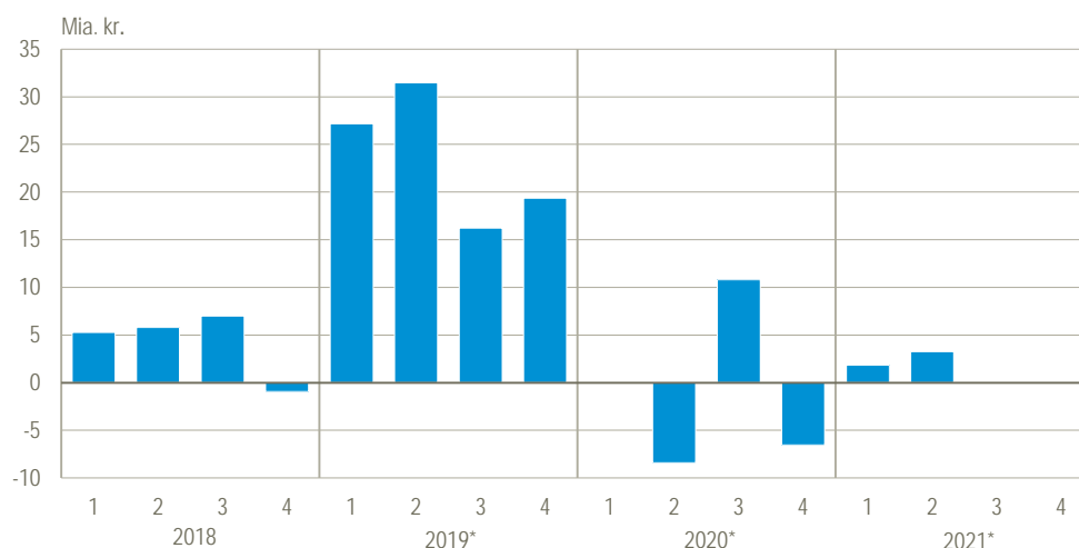
Figur 2. Den offentlige saldo (fordringserhvervelsen, netto)