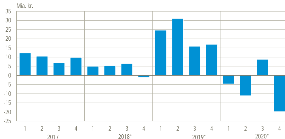
Figur 2. Den offentlige saldo (fordringserhvervelsen, netto)