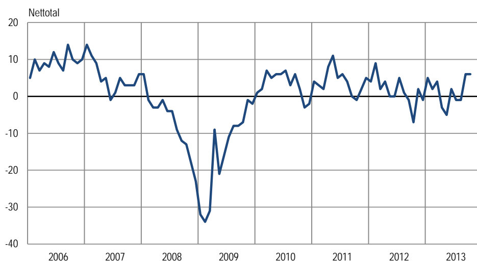
Sammensat konjunkturindikator for industri, sæsonkorrigeret

Anm.: Den sammensatte konjunkturindikator er en sammenvejning af forventet produktion, vurderet ordrebeholdning og vurderede færdigvarelagre.