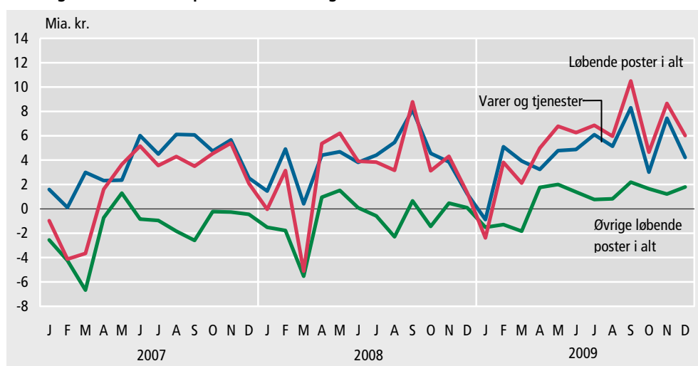
Betalingsbalancens hovedposter, nettoindtægter

I 2009 var der et overskud på betalingsbalancens løbende poster på 64,2 mia. kr. Det er 26,2 mia. kr. højere end i 2008. Man skal tilbage til 2005 for at se et tilsvarende overskud på betalingsbalancen, der dengang var på 67,1 mia. kr.