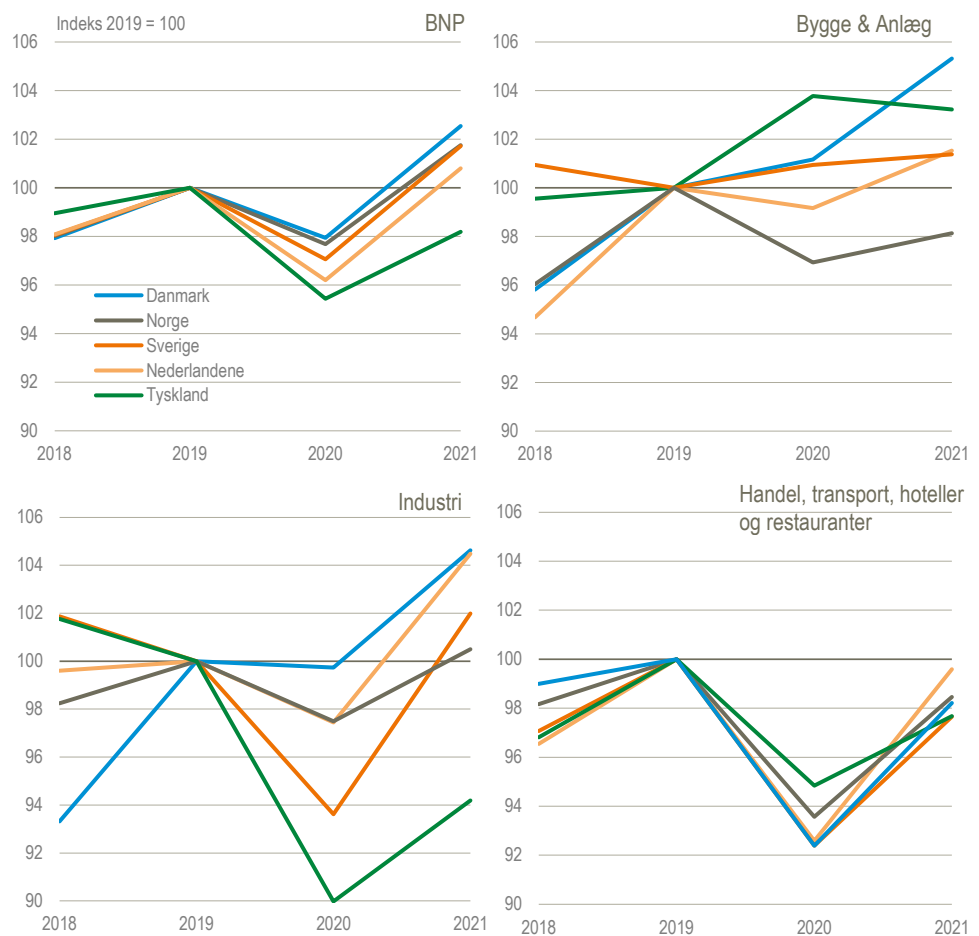
BNP samt bruttoværditilvækst i udvalgte brancher og lande, 2010-priser, kædede værdier

Anm.: Tal for Danmark er foreløbige for 2019-2021.