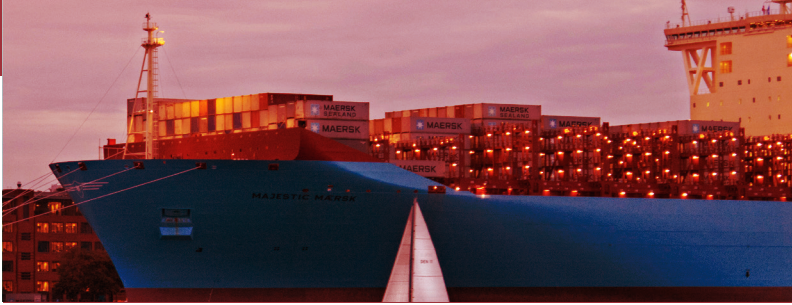
Verdens største containerskib, Majestic Mærsk, i Københavns havn. September 2013.